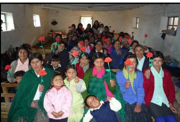
El Calvario (arriba) y Maqui-Maqui (abajo)

Termine mi trabajo en El Calvario, y los ministerios de Niños y Mujeres siguen adelante. Gloria a Dios! Las mujeres en Lanchipampa se desanimaron, pero fui a alentarles y prometieron seguir con sus cultos. Sus niños siguen con la Esc. Bíblica muy bien. En Maqui-Maqui ambos ministerios siguen bien, gracias a Dios, pero necesitarán ser visitados pronto. Por favor, recuérdennas siempre en sus oraciones... Gracias.