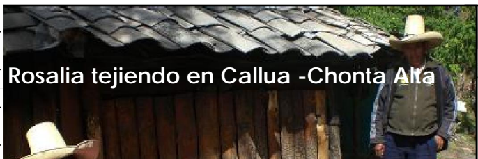
Rosalía tejiendo en Callua -Chonta Alta