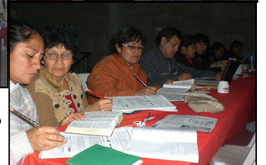
(Arriba) Cantando todos. Hermanas que idearon maneras de presentar el Libro sin Palabras (Derecha- Arriba). Y un grupo completando una practica bien concentrados.