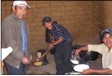
Los hombres cocinaron y sirvieron! 7 Mujeres de CBC me ayudaron!

Fue la primera vez que se hizo este tipo de Conferencia (también la de Niños) . Hubo un promedio de 70 mujeres, asistieron 8 Iglesias. Duro todo el día viernes y mitad de sábado. Se cumplió todo lo planeado Como tiempo de “Consejitos femeninos”, Mensajes específicos (casadas, solteras), Noche especial con evangelismo, Concursos, caminata con propósito, manualidades y premios! El hecho de que la Iglesia de CBC se involucrara con su ministerio de Mujeres fue una bendición. No hubiese podido sola. Ellas trabajaron mucho y se quedaron con ganas de ayudar más! Hubo simultáneamente un aniversario cerca, por esa razón no vinieron mujeres de varios caseríos. De todos modos, es más difícil iniciar algo así con adultos, sin haber precedentes. Pero igualmente fue un gran logro, por la gracia de Dios.